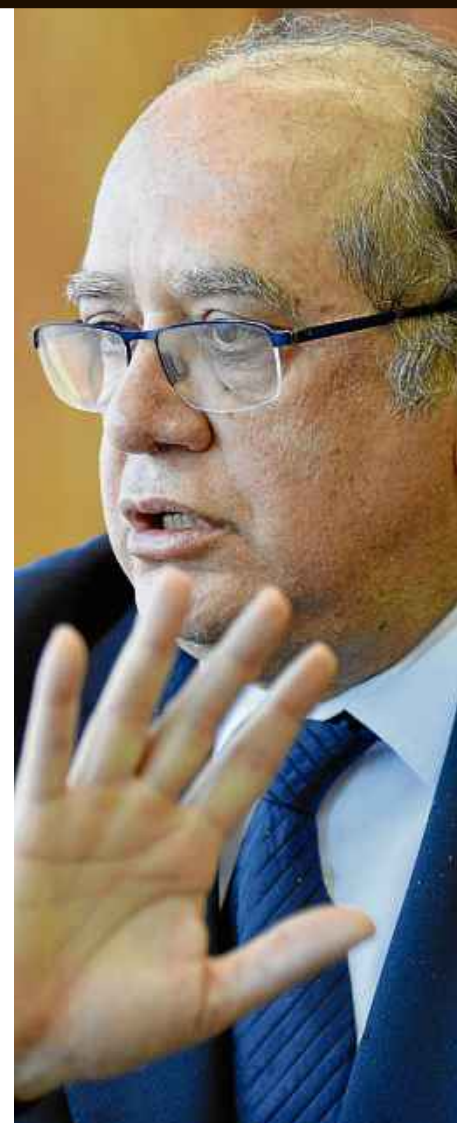
Gustavo Morero/CB/D.A. Press

Ele está convencido de que o mensalão e o petrolão não configuram apenas escândalos de desvio de dinheiro público. "Todos os indícios levam a crer que se trata de um método de governança", destaca Gilmar Mendes. "Agora, se ninguém sabe e ninguém viu, precisa ir ao oculista." Ministro do STF, vice-presidente do TSE e relator das contas de campanha de Dilma no tribunal eleitoral, Mendes acredita que dinheiro desviado da Petrobras ajudou a bancar a reeleição da presidente. "Há indícios bastante fortes de crimes. Cabe ao Ministério Público e à Polícia Federal procederem às investigações", diz.